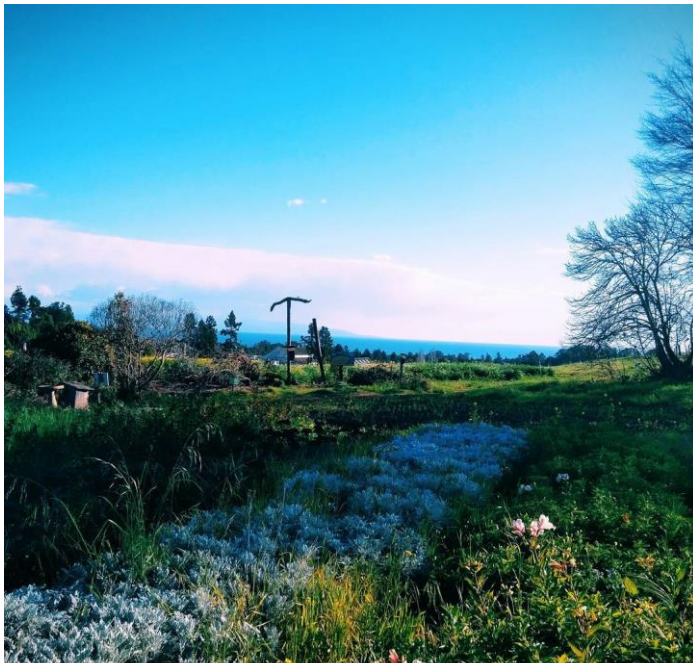
Εικόνα 5 Στιγμιότυπο από το αγρόκτημα του κέντρου μελέτης αγροοικολογίας του πανεπιστημίου της Σάντα Κρουζ (CASFS) (Πηγή: Κ. Καλαϊτζογλου).

Τα διαρκή συμμετοχικά ερευνητικά προγράμματα στην περιοχή της κεντρικής Καλιφόρνια οδήγησαν σε ένα σταδιακό χτίσιμο εμπιστοσύνης, που σε συνδυασμό με τα ιδιαίτερα χαρακτηριστικά της περιοχής και την ευνοϊκή αγορά, έδωσαν ώθηση στην παραγωγή βιολογικής φράουλας και όχι μόνο. Η αλληλεπίδραση των εμπλεκόμενων μερών εδραίωσε ένα σταθερό δίκτυο γνώσης το οποίο αποτελεί την βάση της επιτυχημένης βιολογικής παραγωγής φράουλας στην περιοχή.