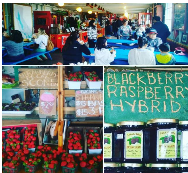
Εικόνα 6 Το κατάστημα του Τζιμ Κόχραν (Swanton Berry Farms) που βρίσκεται στο αγρόκτημα φράουλας. Και τα δύο αποτελούν πόλο έλξης για τους κατοίκους και τουρίστες της Σάντα Κρουζ (Πηγή: Κ. Καλαϊτζογλου).