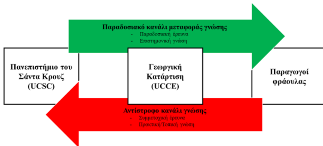
Εικόνα 3 Κύριο και αντίστροφο κανάλι γνώσης μεταξύ του πανεπιστημίου, της γεωργικής κατάρτισης και των παραγωγών φράουλας.

Η φύση της συμμετοχικής έρευνας του πανεπιστημίου της Σάντα Κρουζ σε συνδυασμό με την έντονη δραστηριότητα της γεωργικής κατάρτισης, κατάφερε να δημιουργήσει δεσμούς εμπιστοσύνης μεταξύ επιστημόνων και παραγωγών. Η σχέση επιστήμονα-παραγωγού είναι αμφίδρομη. Από τη μία μεριά, ο επιστήμονας δίνει απαντήσεις σε προβλήματα παραγωγής και από την άλλη, ο παραγωγός υπενθυμίζει διαρκώς την διαφορά του εργαστηρίου απ’ το χωράφι (Εικόνα 3).